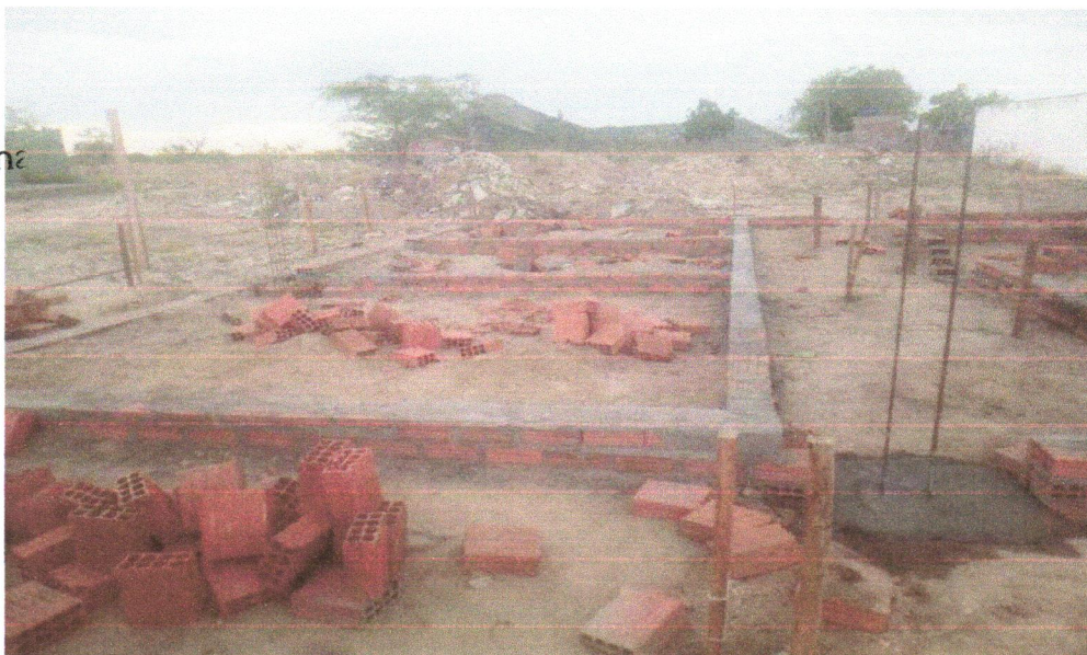
FOTO 8 - COMPOSIÇÃO REPRESENTATIVA) EXECUÇÃO DE ESTRUTURAS DE CONCRETO ARMADO, PARA EDIFICAÇÃO HABITACIONAL UNIFAMILIAR TÉRREA (CASA EM EMPREENDIMENTOS), FCK = 25 MPA. AF_01/2017