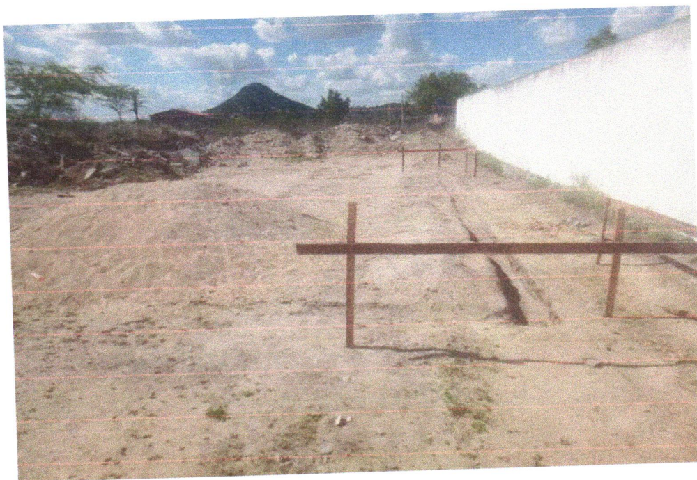
FOTO 03 - ESCAVAÇÃO MANUAL DE VALA PARA VIGA BALDRAME (INCLUINDO ESCAVAÇÃO PARA COLOCAÇÃO DE FÔRMAS). AF_06/2017