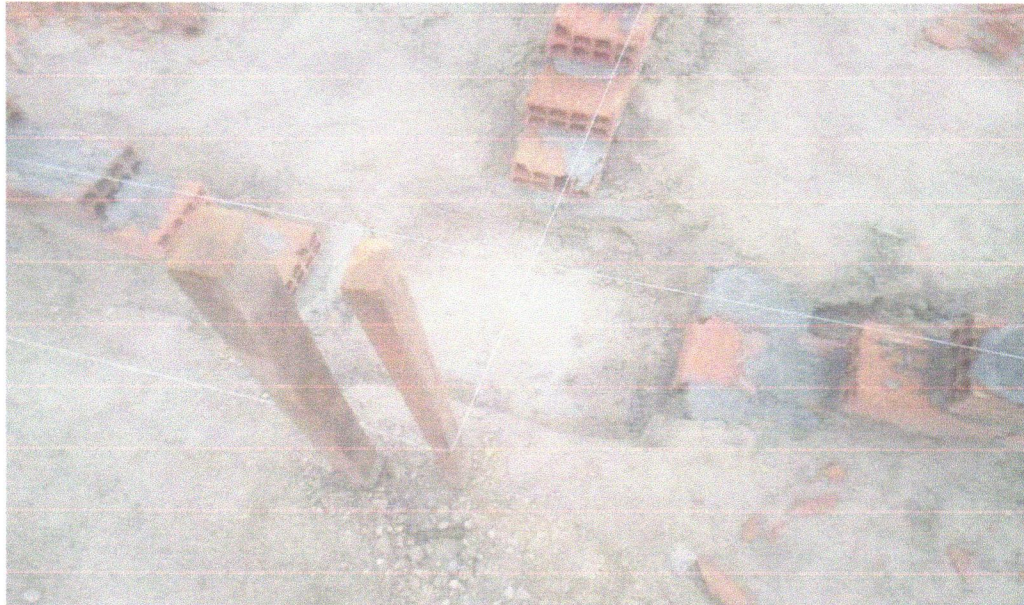
FOTO 05 – ESCAVAÇÃO MANUAL DE VALA PARA VIGA BALDRAME (INCLUINDO ESCAVAÇÃO PARA COLOCAÇÃO DE FÔRMAS). AF_06/2017