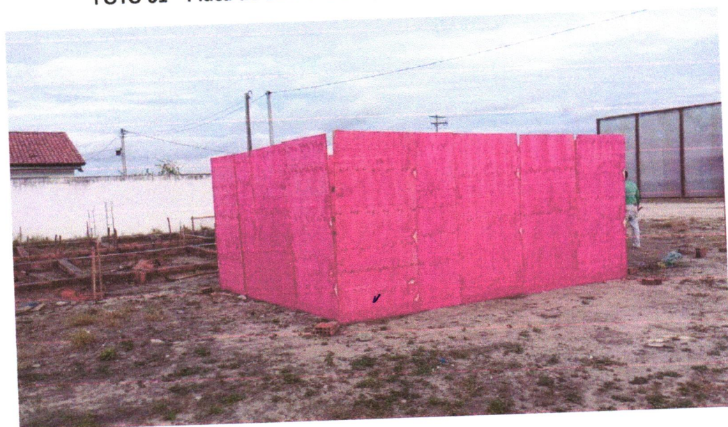
FOTO 02 - Barracão para Obras de Médio Porte Reaproveitamento 2 vezes