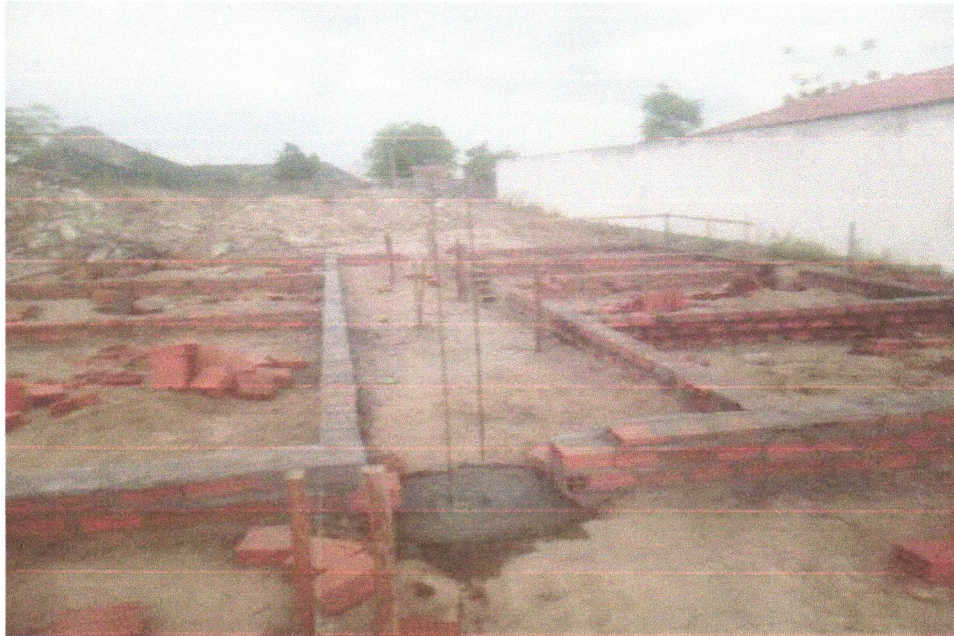
FOTO 07 – ESCAVAÇÃO MANUAL DE VALA PARA VIGA BALDRAME (INCLUINDO ESCAVAÇÃO PARA COLOCAÇÃO DE FÔRMAS). AF_06/2017