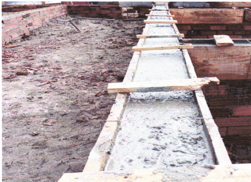
FOTO 9 – COMPOSIÇÃO REPRESENTATIVA) EXECUÇÃO DE ESTRUTURAS DE CONCRETO ARMADO, PARA EDIFICAÇÃO HABITACIONAL UNIFAMILIAR TÉRREA (CASA EM EMPREENDIMENTOS), FCK = 25 MPA. AF_01/2017