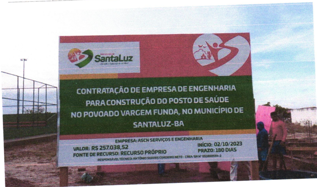
FOTO 01 - Placa de obra em chapa aço galvanizado, instalada